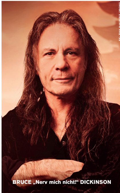
BRUCE „Nerv mich nicht!“ DICKINSON

PPS: Unser für den 18. September geplantes Kurz-Festival Rock Hard One Day war innerhalb weniger Tage ausverkauft. Vielen Dank dafür! Ob es wirklich stattfinden kann, ist beim Schreiben dieser Zeilen nicht abzusehen. Bitte checkt unsere diversen Online-Kanäle, um auf dem Laufenden zu bleiben!