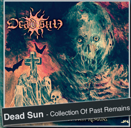
Dead Sun - Collection Of Past Remains

worshipping SWEDISH DEATH METAL Partly previously unreleased songs since 2013