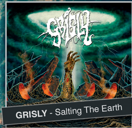
GRISLY - Salting The Earth

SWEDISH DEATH METAL supreme! Paganizer follow-up feat. Rogga Johansson